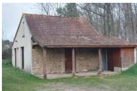
Salle St Martin Capacité : 40 personnes