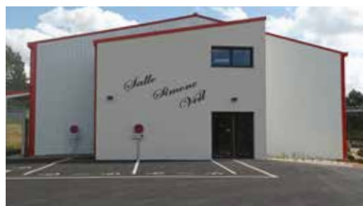
Salle Simone Veil Capacité : 250 à 300 personnes