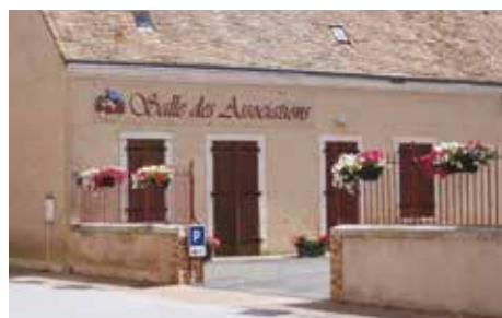
Salle des associations Capacité : 70 personnes

Pour l'ensemble des salles : paiement d'un acompte de 30% à la réservation et paiement du solde un mois avant l'évènement.